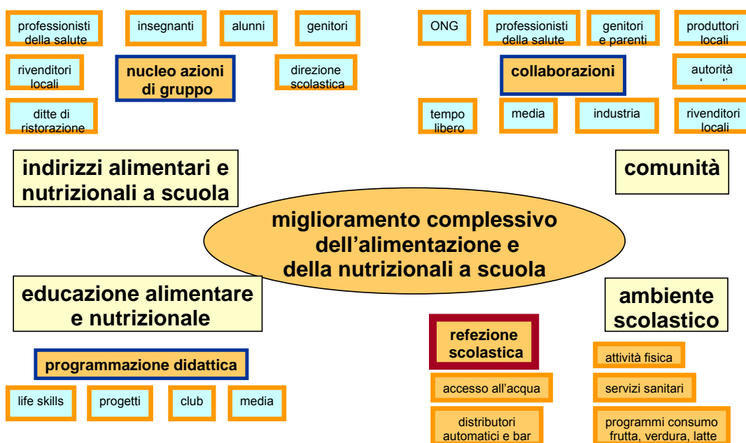
Figura 1: approccio olistico delle politiche alimentari e nutrizionali per la scuola

Il presente lavoro si inserisce nell'elemento "ambiente scolastico" e si articola anche su altre dimensioni che il pasto a scuola intercetta, con speciale attenzione ai determinati sociali, per portare in primo piano la centralità dell'età scolare che necessita di precoci e adeguati interventi nutrizionali, al fine di soddisfare i particolari fabbisogni fisiologici di nutrienti e di energia.