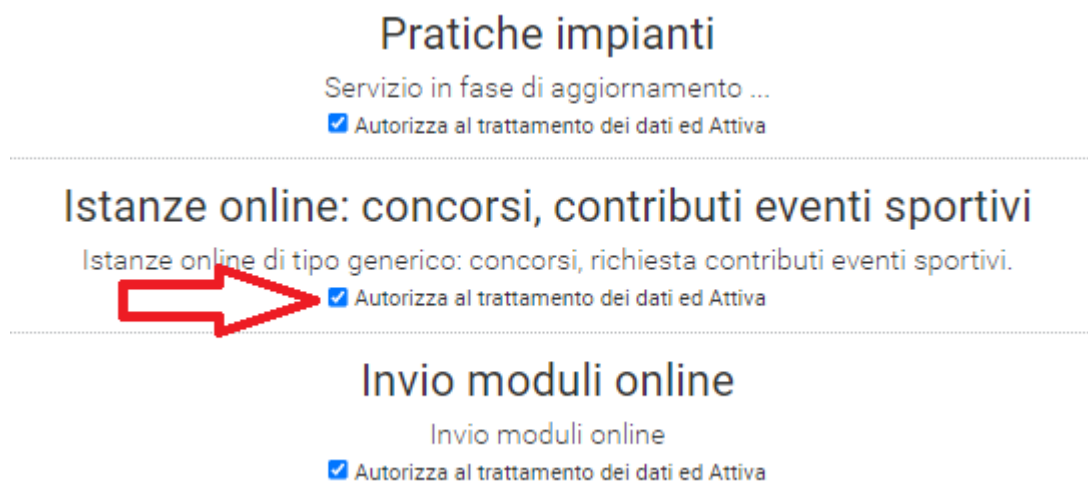
Figura 4 - Attivazione servizio Istanze online: concorsi, contributi eventi sportivi

Cliccando il pulsante sarà possibile visualizzare tutti i servizi disponibili sul portale, verificare che la spunta relativa al servizio “Istanze online: concorsi, prenotazione servizi” sia selezionata (vedi figura 4), nel caso non lo fosse, attivarla e cliccare sul pulsante “Salva modifiche”. Il servizio sarà ora presente nei “Servizi Privati”.