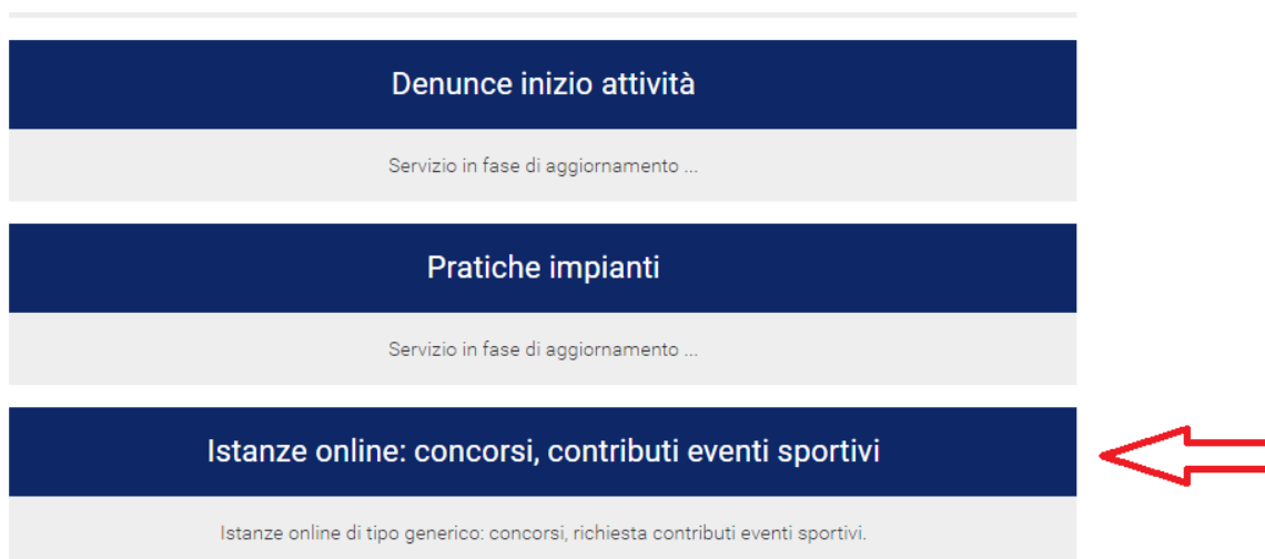
Figura 3 - Menu servizi sezione privata

Entrando nell'area personale verranno proposti diversi servizi disponibili, cliccare su “Istanze online: concorsi, contributi eventi sportivi”.