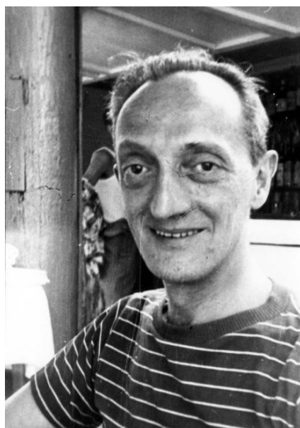
Giorgio Scerbanenco a Lignano Sabbiadoro

Fb: Festival Lignano Noir - Omaggio a Giorgio Scerbanenco