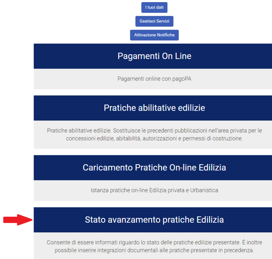
Figura 3 - Menu servizi Sezione Privata

Nel caso non fosse visibile il servizio “Stato avanzamento pratiche Edilizia” cliccare sul link in alto a destra con scritto “Ciao” seguito dal proprio nome; nella nuova pagina sotto il titolo “LA TUA SEZIONE PRIVATA” sarà ora visibile il pulsante “Gestisci servizi”.